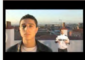
Fuerza de voluntad Hip Hop, Rap